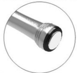
Cold&Heat Hammer Headpiece