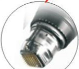
SFR 49 Pin Tip