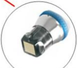
MFR 25 Pin Tip