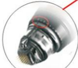
SFR 25 Pin Tip