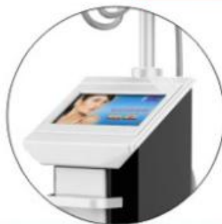
10.4Inch TFT Screen