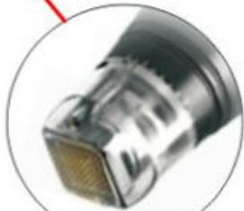
SFR 81 Pin Tip